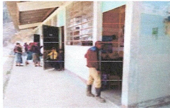
ESTA IMAGEN MUESTRA LOS TRABAJOS DE LIMPIEZA DE LOS VENTANALES