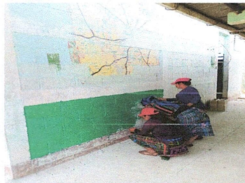
ESTA IMAGEN MUESTRA LOS TRABAJOS DE PINTURA DEL ESTABLECIMIENTO

Observación: Si es necesario se pueden agregar hojas adicionales y actualizar el número de hojas.